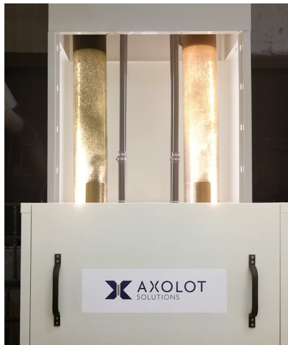
AxoPur-anläggning i reguljär drift.